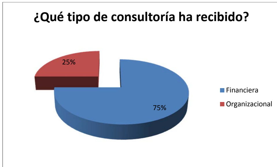
Gráfico 3. Tipo de Consultoría agroindustrial

Los servicios independientes han sido contratados a personal de las cámaras empresariales y profesores de universidades locales. Los empresarios manifestaron que ellos como parte del sector agroindustrial, requieren consultoría en las áreas financieras, procesos productivos, investigación de mercados y mercados y en planes de organización (Ver gráfico 4).