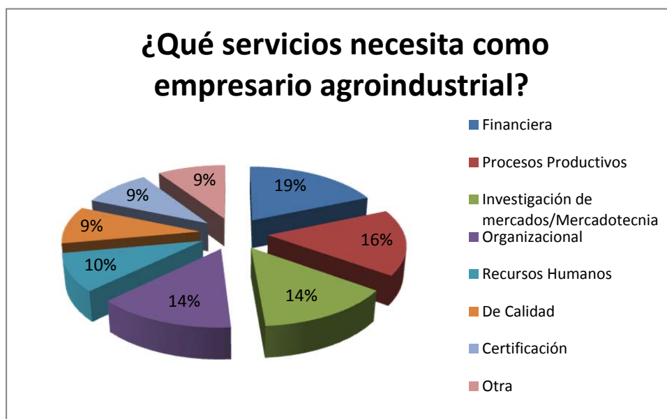
Gráfico 4. Servicios agroindustriales requeridos.